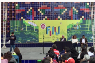
Lectura del Principito

El 8 de noviembre por la mañana, en las instalaciones del Centro Nacional de las Artes (CENART), se escucharon durante 3 horas las palabras de la novela más famosa de Antoine de Saint Exupéry, El Principito , declinado en cuatro idiomas : francés, español, otomí y náhuatl. Este Maratón de lectura se realizó en el marco de la Feria Internacional del Libro Infantil y Juvenil (FILIJ 2015) , de la cual Francia fue país invitado, en presencia de la presidenta de la Universidad Intercultural del Estado de Hidalgo, Verónica Kugel, iniciadora