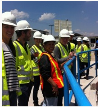
Visita al Túnel Emisor Oriente