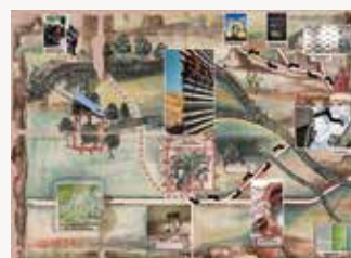
Maletín digital "Migr'Art. Territorios y desplazamientos".