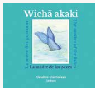
Cuento multimedia "Wichā akaki".

Asimismo, en el mes de julio se publicó el cuento multimedia "Wichā akaki" de Claudine Chamoreau, para dar difusión a la lengua Pesh de Honduras. Un segundo cuento multimedia "Takaskro" será publicado entre finales de 2017 y principios del 2018.