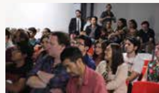
Presentación del documental "Naachtún, la ciudad maya olvidada".