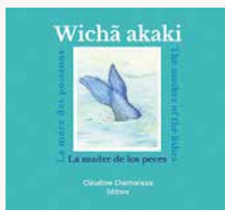
Conte multimédia « Wichā akaki ».