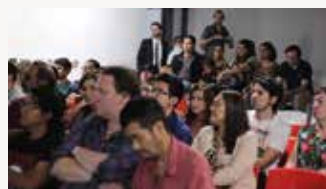
Présentation du film « Naachtún, la ville maya oubliée ».