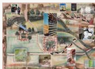
Mallette numérique « Migr'Art. Territoires et déplacements ».